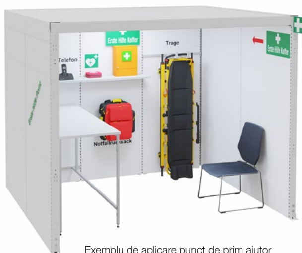
Exemplu de aplicare punct de prim ajutor