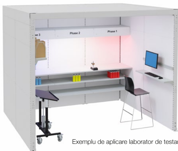
Exemplu de aplicare laborator de testare