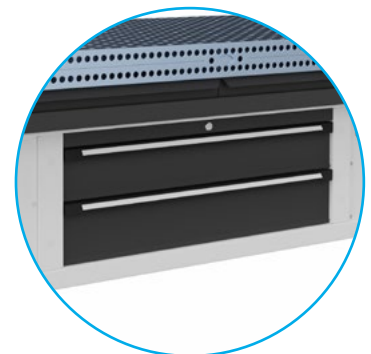
Schubladen für Werkzeuge