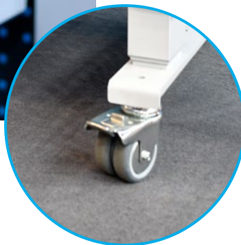
Fahrbar dank Lenkrollen