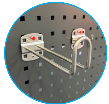
Ablagemöglichkeit an Seitenwand